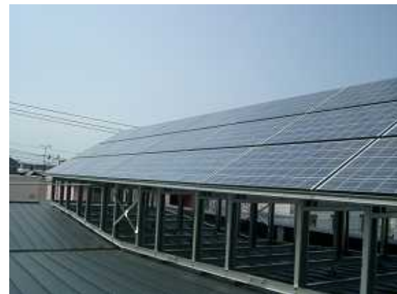
15、モジュールの取付完了。