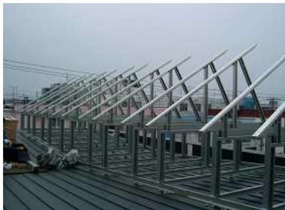
13、モジュール架台の組立。