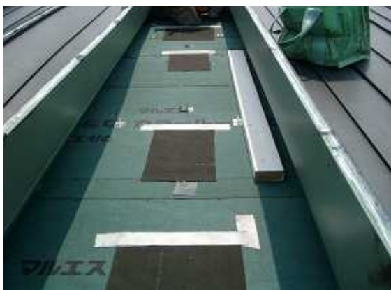
4、防水補強で気密テープを上側にはります。