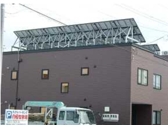
23、建物のうしろから見た全景。