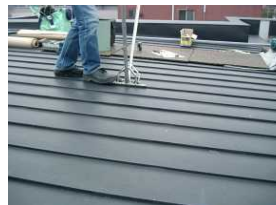
6、ハットを納めていきます。