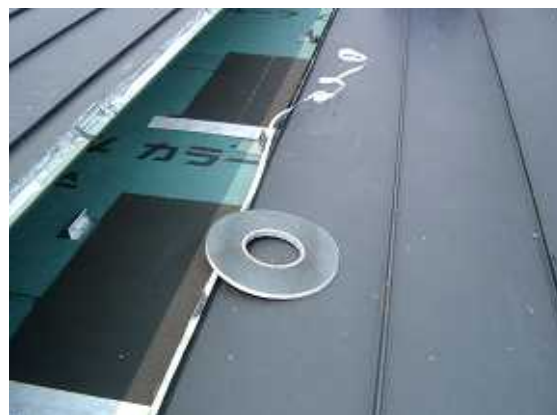
5、ハットの部分に気密防水の為にハットテープをはります。