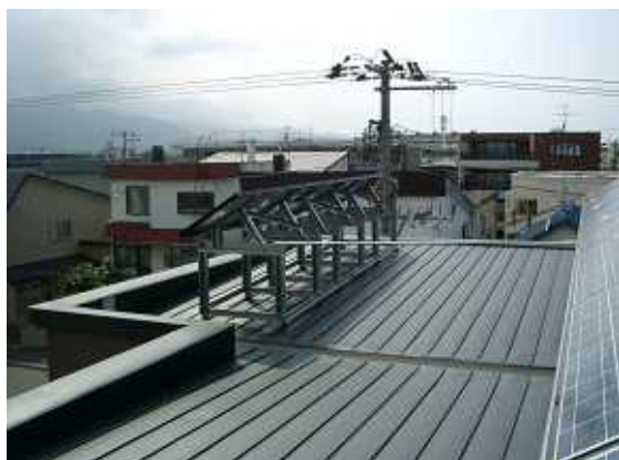
16、モジュールの取付完了。前列のモジュール配線は金属電線管で後列と接続。