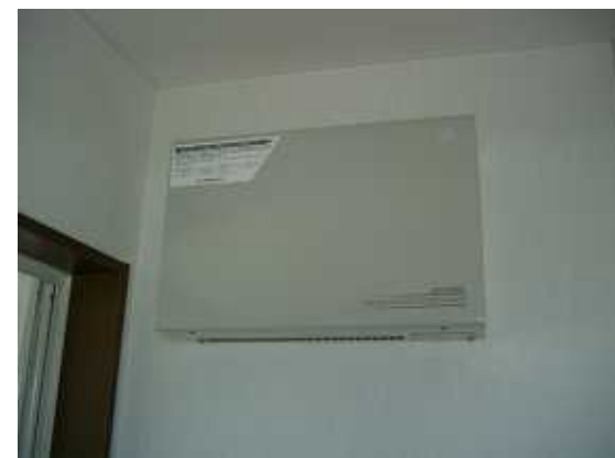
18、パワーコンディショナー。