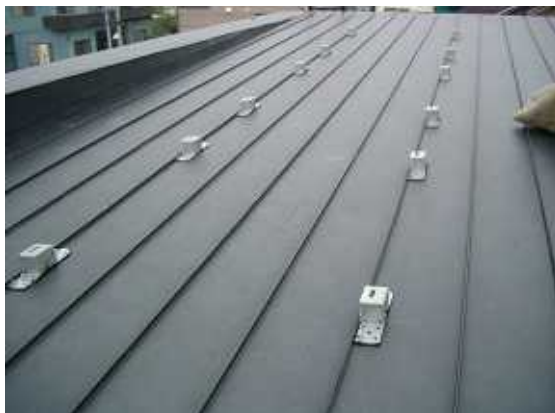
8、ハットを取付ます。