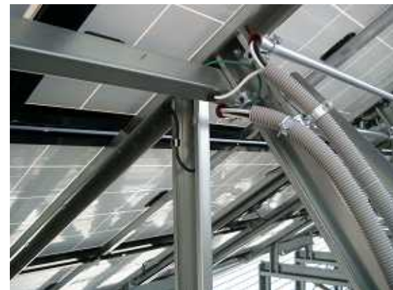
21、ケーブルは金属管や保護管の通して。