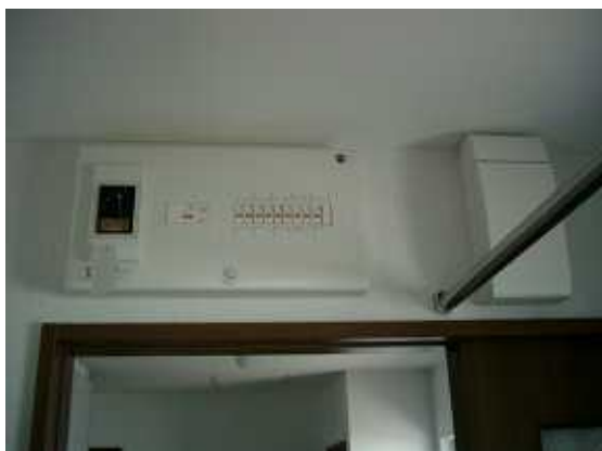
17、連系用ブレーカーとボックス。