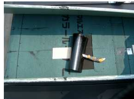
3、板の上からゴムアスルーフingをはります。