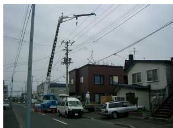
11、クレーンでの荷上。