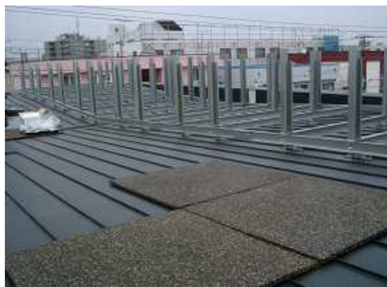
10、H-ス架台の組立と荷上の養生。