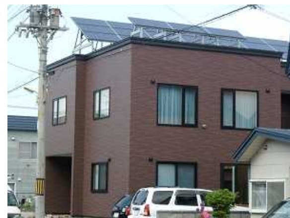
24、建物前から見た全景。