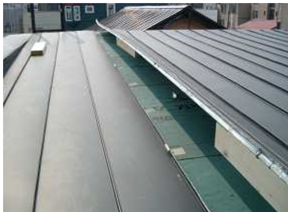
1、補強板を入れる為屋根をはがします。