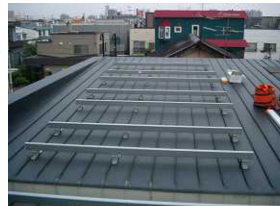
9、H-ス架台の組立をします。