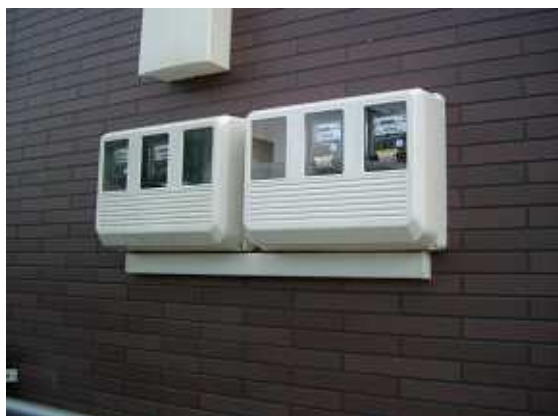
22、右側が売電メーター(2世帯)。