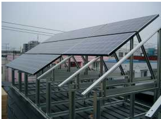
14、モジュールの取付。