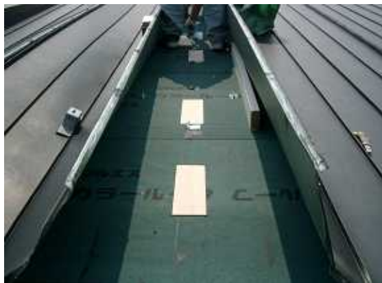
2、ハットの取付 にスタイロフォームを切って板をはります。