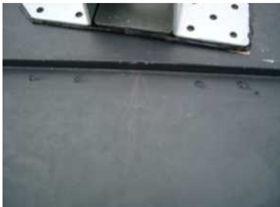
7、ハットの取付の下穴をあけてコーキングをいれます。