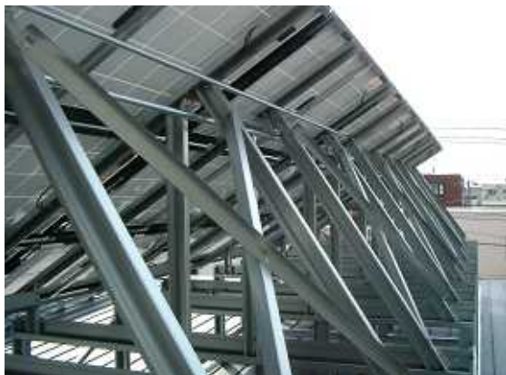
20、ケーブルは金属管やクリップでスッキリと。